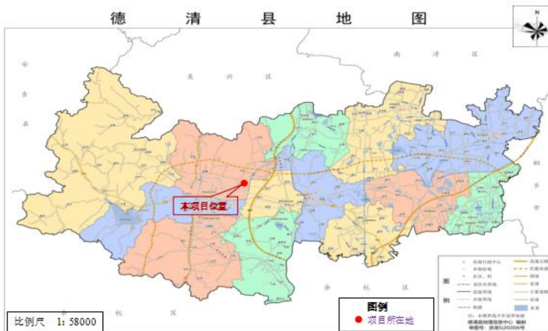
图 3-1 本项目地理位置图

本项目建设地点位于浙江省湖州市德清县阜溪街道环城北路 889 号,生产经营场所中心点坐标为东经 120° 02' 10.126", 北纬 30° 55' 9.945"。