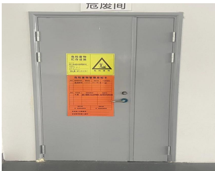
图 4-2 危废仓库

废金属部件、废电线、废塑料外壳、废壳体、废纸箱、废抹布、废金属屑、废铝壳暂存于一般固废仓库（30m 2 ），定期出售给物资回收单位；废黄油、废油桶、废电路板暂存于危废仓库（20m 2 ），定期委托资质单位处置。