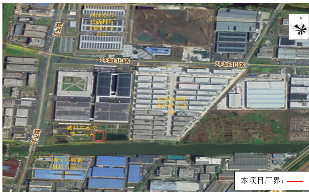
图 3-2 本项目周围状况图