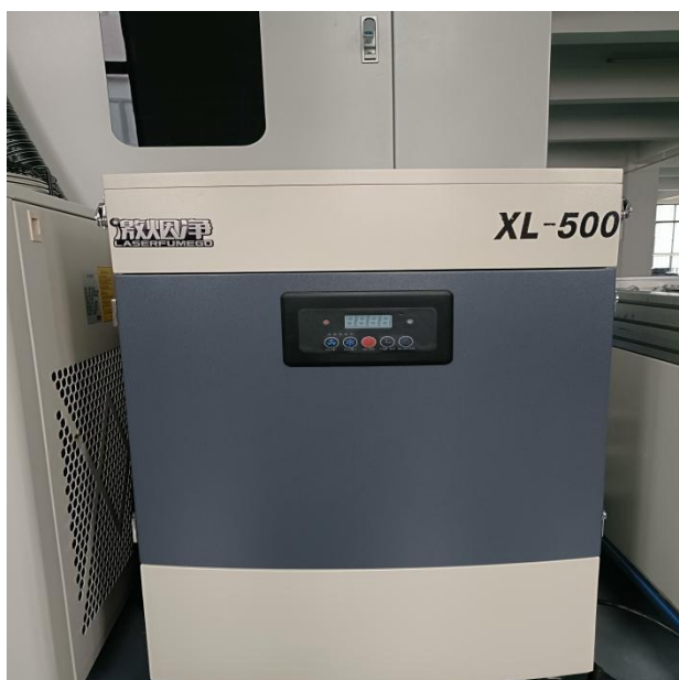
图 4-1 净化处理装置